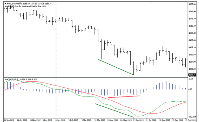
รูปที่ 2 Bullish Divergence ระหว่างราคา และ Macd Line และ Macd Histogram

จากตัวอย่างในรูปที่ 1 เส้นสีเขียวคือ Macd Line และเส้นสีแดงคือ Signal Line ส่วนแท่งสีน้ำเงินคือ Macd Histogram ซึ่งเป็นผลต่างระหว่างเส้น Macd Line และเส้น Signal Line นั้นเอง จากบริเวณช่วงกลางของรูปที่ 1 จะเห็นว่าหาก Macd Line มีระยะห่างจากเส้น Signal Line มากขึ้น จะทำให้แท่ง Macd Histogram สูงขึ้น ซึ่งเป็นสัญญาณที่บ่งบอกว่าการปรับตัวเพิ่มขึ้นของราคาจะมี momentum ที่เพิ่มสูงขึ้นนั่นเอง